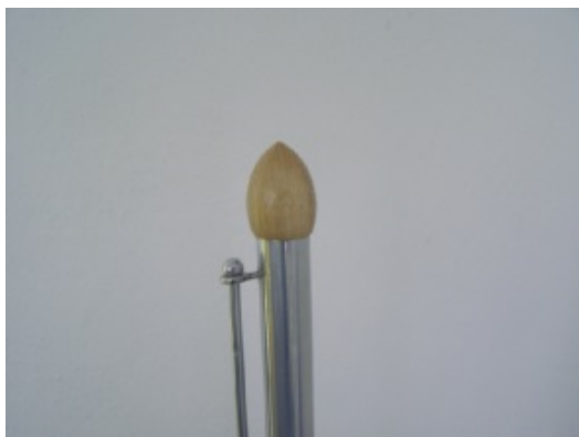
Detail špičky a tyčky